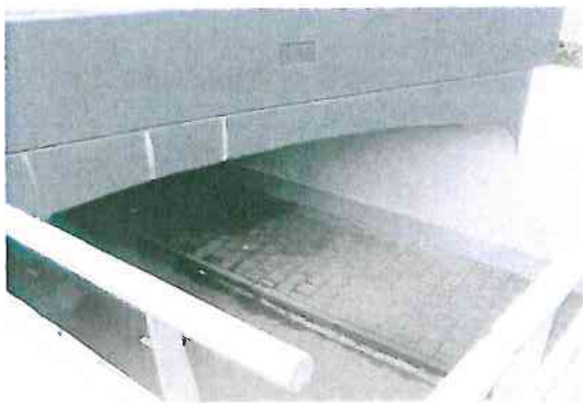
Optisch korte tunnel door middenberm niet te overkappen.