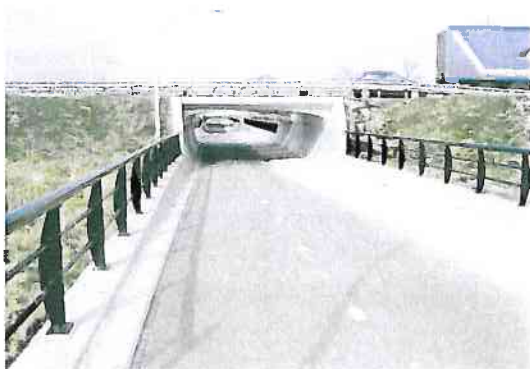
Beplanting open en laag.

Eerdergenoemde doelstellingen en ontwerpeisen zijn getoetst aan de aanbevelingen die de Fietsersbond naar aanleiding van een fietstunnelonderzoek voor Zwolle Zuid in 2004 heeft gedaan. De aanbevelingen van de Fietserbond kwamen overeen met de opgestelde ontwerpeisen. Ook politiekeurmerk 'veilig wonen' had geen aanvullende ontwerpeisen.