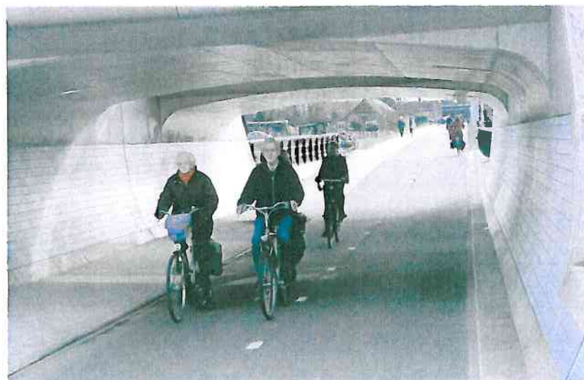
Veilige tunnel (Hasselterweg).