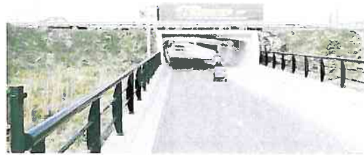
Doorzicht vergroten door weg iets op te tillen. Geen trapopgangen en onveilige plekken.