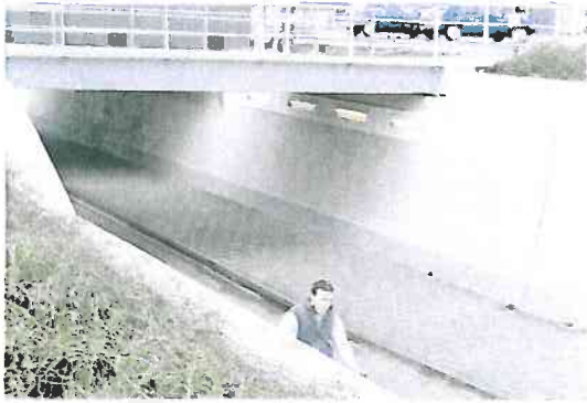
Goede en vandalismebestendige verlichting.