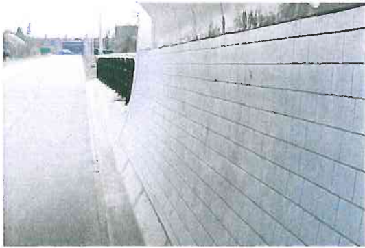
Lichte en rustige kleurstelling van wanden en plafond.