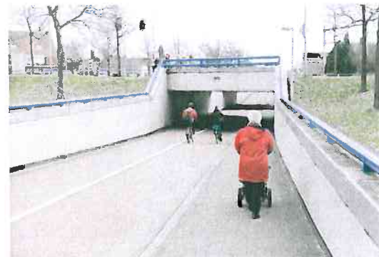
Voetpad naast het fietspad.