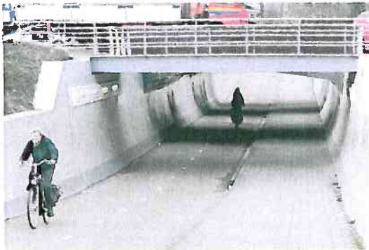
Doorzicht door tunnel, zo gestrekt mogelijk.