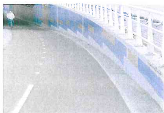
Tegels zijn graffiti-bestendig.