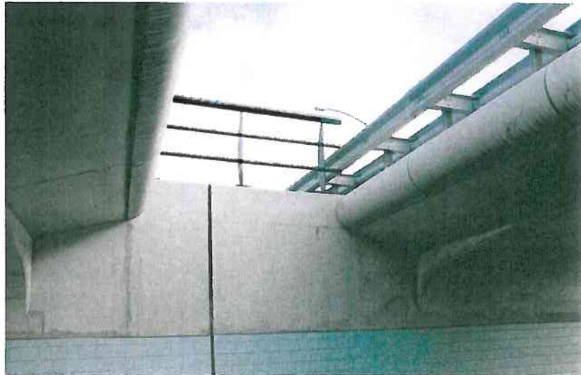
Daglichttoetreding door niet overkappen van middenberm.