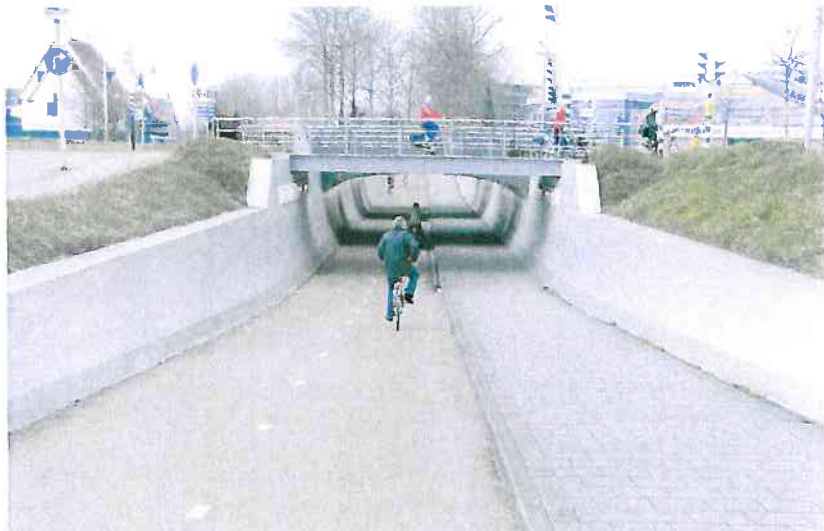
Veilige tunnel (Zwarte Water Allee).