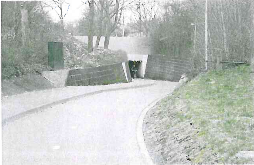
Onveilige tunnel (Ittersum Allee Tunnel).