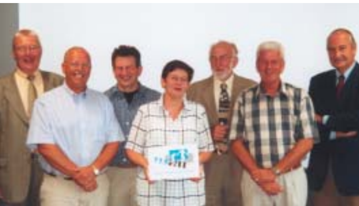
De BVL-commissie, vlnr: