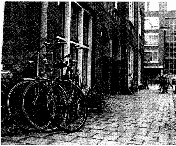
Westerpark: 'Gangen beslist niet breed genoeg om er ook nog een fiets neer te zetten.'

tingen zou het aantal fietsen dat in de hoofdstad vervolgens van eigenaar wisselt, de 150.000 stuks per jaar ruimschoots overschrijden. "En dat leidt ertoe dat mensen gedemotiveerd raken om een fiets aan te schaffen", zegt Terlouw. Het voorkomen van diefstal is wat haar betreft dan ook vooral bedoeld om het fietsbezit en daarmee het gebruik ervan te stimuleren.