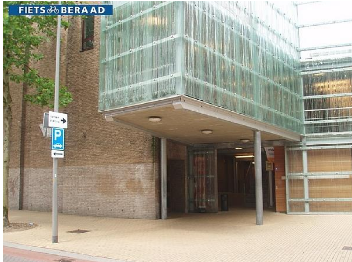
Transparante fietsparkeermachine Apeldoorn, De Serre, Kanaalstraat 2005