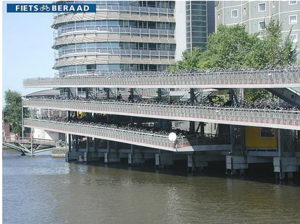
Fietsflat Amsterdam, Centraal Station 2007