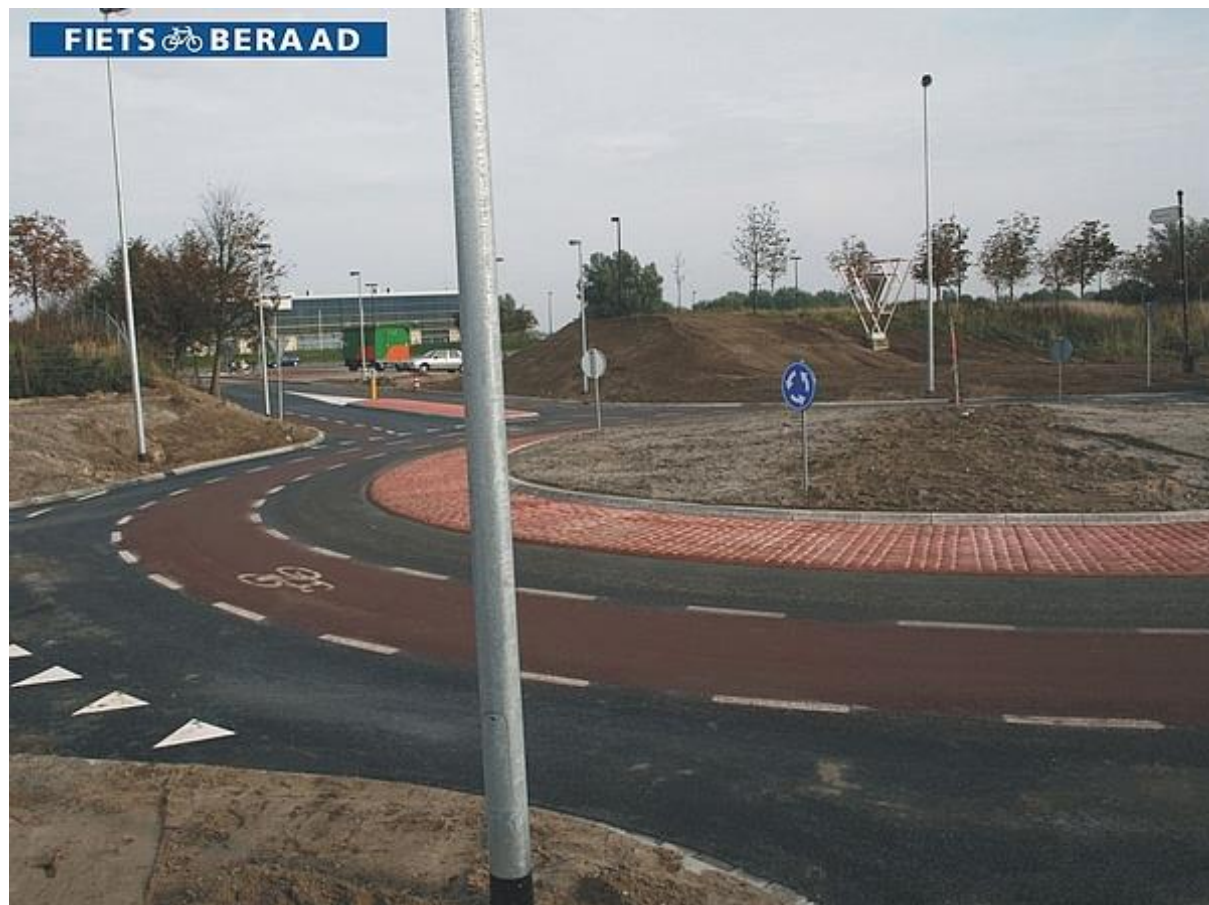
Fietsrotonde voorkomt dode hoek Lelystad, Museumweg 2006