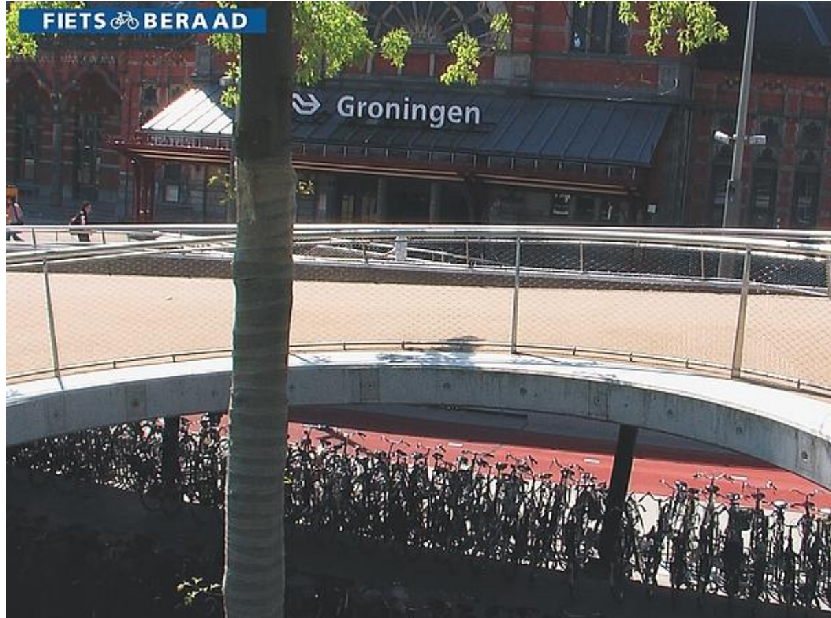
Stadsbalkon fietsenstalling Groningen 2006-2007