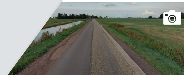
Hetzelfde generieke dwarsprofiel kan op de Kamper Wetering over de gehele lengte worden toegepast.