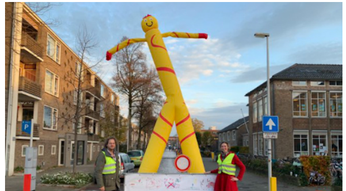
opening schoolstraat Utrecht 9 november 2020